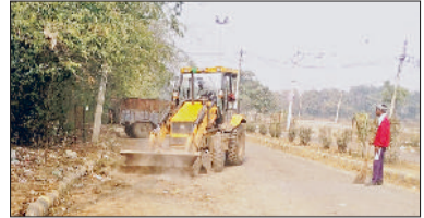
भिवानी। उपायुक्तों के आदेशों के बाद सफाई करती जेसीबी।