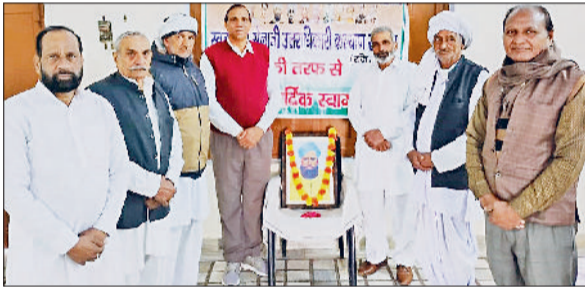
भिवानी। महान स्वतंत्रता सेनानी एवं क्रांतिकारी शहीद हुकुमचंद जैन को नमन