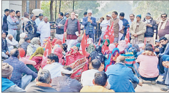
भिवानी। लघु सचिवालय के मुख्यद्वार पर विरोध प्रदर्शन करते और मांगों को लेकर ज्ञापन सौंपते विभिन्न विभागों के कर्मचारी।