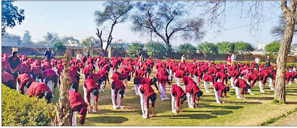
भिवानी। आयोजित शिविर में योगा करावते हुए।